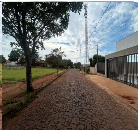
FOTO 7 - VIA DE ACESSO E ENTORNO