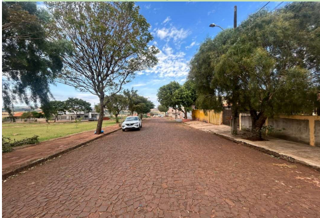
FOTO 8 - VIA DE ACESSO E ENTORNO