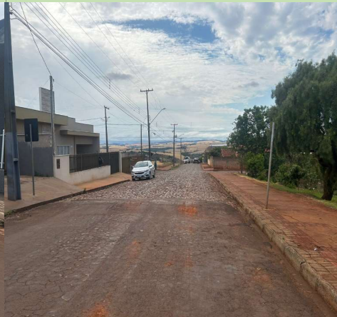
FOTO 11 - VIA DE ACESSO E ENTORNO