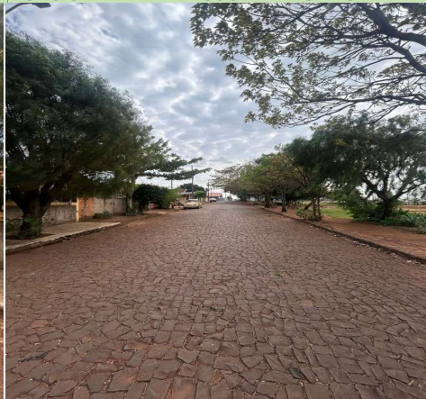
FOTO 9 - VIA DE ACESSO E ENTORNO