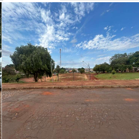
FOTO 1 - VISTA FRONTAL