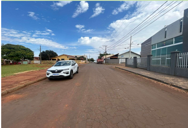
FOTO 10 - VIA DE ACESSO E ENTORNO